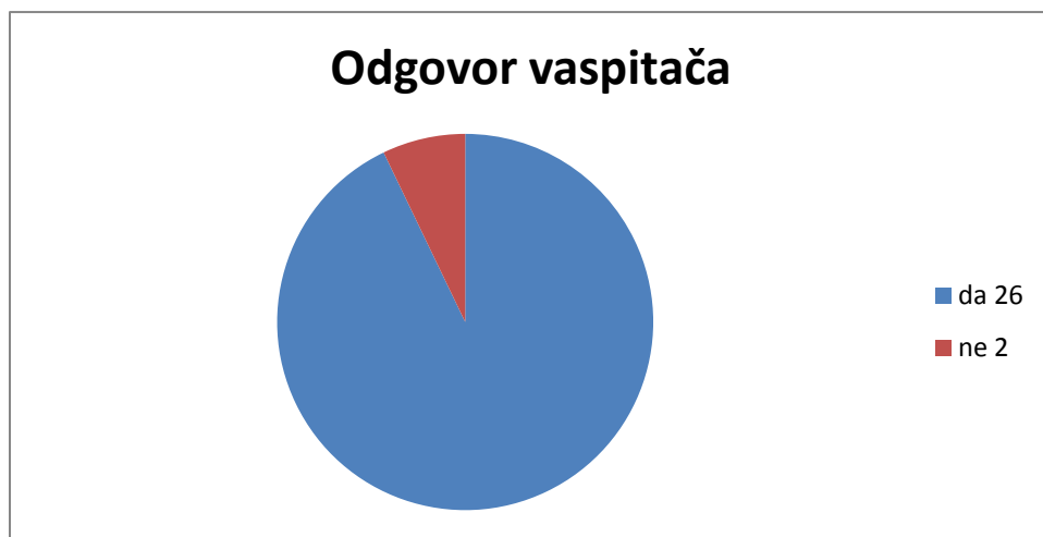
Grafikon 3: Prikaz rezultata odgovora vaspitača na pitanje Da li čitanje slikovnice pomaže ispravljanju govornih grešaka kod dece?

Ovi rezultati pokazuju da većina vaspitača (26 od 28) veruje da čitanje slikovnica pomaže u ispravljanju govornih grešaka kod dece. Ovo je veoma pozitivan nalaz jer ukazuje na to da vaspitači percipiraju slikovnice kao koristan alat ne samo za razvoj jezičkih veština već i za poboljšanje preciznosti i jasnoće govora kod dece.